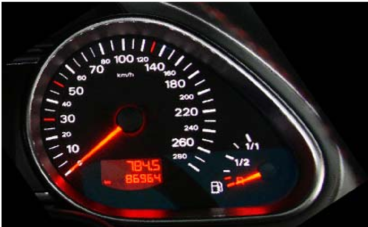
Bild 1: Spiegelungen und Reflexionen an beleuchteten Komponenten im Fahrzeuginnenraum

Neben diesen positiven Eigenschaften gibt es bei der Gestaltung von Fahrzeuginnenräumen aber auch häufig Schwierigkeiten mit unerwünschten Nebeneffekten. In vielen Fahrzeugen werden für ein hochwertiges Design polierte Materialien, Chrom-Oberflächen oder ähnliches eingesetzt. Die Vielzahl an Lichtern kann insbesondere an diesen Hochglanzflächen zu starken Reflexionen führen. Es kommt zu ungewollten Spiegelungen und Lichtreflexen, die das Gesamtbild stören oder im schlimmsten Fall sogar den Fahrer ablenken können.