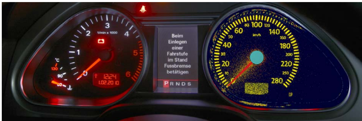
Bild 3: Ergebnisse der Lichtsimulation im Vergleich zur Realität

Durch diese Methodik erarbeiten wir Empfehlungen, um die zu erwartenden Reflexionen zu vermeiden. Diese Vermeidung kann einerseits durch Anpassung der Geometrie der reflektierenden Oberflächen erfolgen. Andererseits können die optischen Eigenschaften durch unterschiedliche Lackierungen, Beschichtungen oder Oberflächenstrukturen beeinflusst werden. Die erarbeiteten Lösungen und deren Wirksamkeit sichern wir wiederum mithilfe der Lichtsimulation ab.