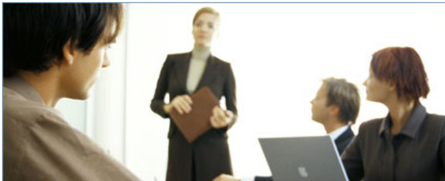
Abb. 4: TRIZ Workshops dienen der Gewinnung innovativer Ideen und Lösungen M.TEC GmbH

M.TEC setzt die TRIZ-Werkzeuge seit langem sehr erfolgreich in der täglichen Arbeit ein. Im Rahmen der Produktentwicklung werden auf diese Weise systematisch Anforderungen ermittelt und innovative Systeme konzipiert, die diese Anforderungen erfüllen. Die Analyse- und Ideen-Tools beschleunigen dabei die Problemlösung, vereinfachen die Dokumentation und führen zu jederzeit nachvollziehbaren und plausiblen Ergebnissen. Diese Vorgehensweise erleichtert die anschließende Bewertung und Auswahl der Lösungen. So können wir z.B. im Falle von neuen oder geänderten Anforderungen in jeder Projektphase gemeinsam mit unserem Auftraggeber eine neue Bewertung der Lösungen durchführen und auf die bereits erarbeiteten Ergebnisse zurückgreifen. Außerdem stehen die auf diese Weise gewonnenen Ergebnisse direkt für andere entwicklungsbegleitende Maßnahmen wie z.B. RiskMan/FMEA-Workshops zur Verfügung.