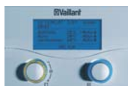
Beleuchtete Bedieneinheit eines Wandheizgerätes: Simulation und Wirklichkeit